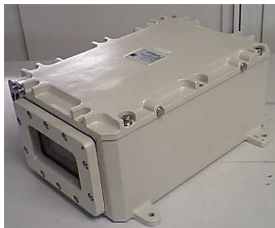
耐圧防爆容器(Exd II BT4)