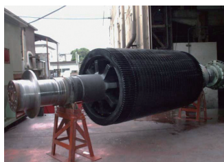
回転子 スチーム洗浄(汚損の除去)