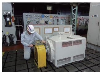
電動機 無負荷試験中