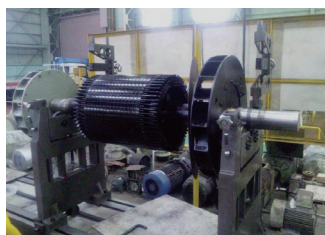
回転子 バランス修正